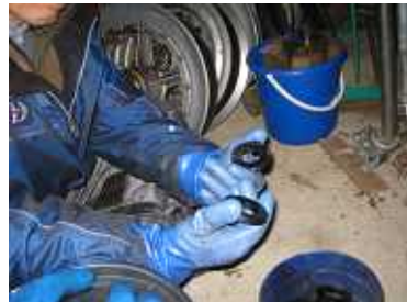
握索機のサラバネ点検及び洗浄作業