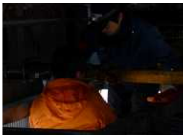
ユニバーサルクロスキットの交換作業